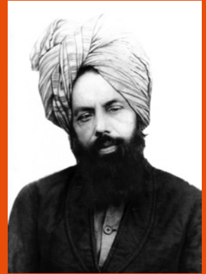
Hadhrat Mirza Ghulam Ahmad AS , der Verheißene Messias und Imam Mahdi des Islam

In der heutigen religiösen Welt spielt die Ahmadiyya Muslim Jamaat eine einzigartige Rolle. Glaube und Vernunft sowie die Lehre, dass zwischen Religion und Wissenschaft kein Widerspruch bestehen darf, sind integraler Bestandteil der Lehren der Ahmadiyya Muslim Jamaat. Diese islamische Reformgemeinde wurde 1889 von Hadhrat Mirza Ghulam Ahmad AS (1835-1908) aus Qadian/Indien gegründet. Er beanspruchte aufgrund göttlicher Offenbarungen der von allen Religionen für die Endzeit angekündigte Reformen und Prophet zu sein, insbesondere der vom Heiligen Propheten Muhammad SAW prophezeite Imam Mahdi, der auch die Wiederkunft von Jesusas repräsentiert. Die Ahmadiyya Muslim Jamaat ist die einzige Gemeinschaft im Islam, die mittlerweile seit mehr als 100 Jahren durch ein spirituelles Khilafat (Kalifentum) geleitet wird. Deziert setzt sich die Gemeinde für die Trennung von Politik und Religion ein. Das jeweilige Oberhaupt heißt Khalifatul Masih, d.h. Nachfolger des Verheißenen Messias AS . Er wird demokratisch durch ein Wahlkomitee der Gemeinde auf Lebenszeit gewählt.