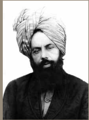
Hadhrat Mirza Ghulam Ahmad as , der Verheißene Messias und Imam Mahdi des Islam

In der heutigen religiösen Welt spielt die AMJ eine einzigartige Rolle. Glaube und Vernunft sowie die Lehre, dass zwischen Religion und Wissenschaft kein Widerspruch bestehen darf, sind integraler Bestandteil der Lehren der AMJ. Diese islamische Reformgemeinde wurde 1889 von Hadhrat Mirza Ghulam Ahmad as (1835-1908) aus Qadian/Indien gegründet. Er beanspruchte aufgrund göttlicher Offenbarungen der von allen Religionen für die Endzeit angekündigte Reform und Prophet zu sein, insbesondere der vom Heiligen Propheten Muhammad saw prophezeite Imam Mahdi, der auch die Wiederkunft von Jesus as repräsentiert. Die AMJ ist die einzige Gemeinschaft im Islam, die mittlerweile seit mehr als 100 Jahren durch ein spirituelles Khilafat (Kalifentum) geleitet wird. Dezidiert setzt sich die Gemeinde für die Trennung von Politik und Religion ein. Das jeweilige Oberhaupt heißt Khalifatul Masih, d.h. Nachfolger des Verheißenen Messias as . Er wird demokratisch durch ein Wahlkomitee der Gemeinde auf Lebenszeit gewählt.